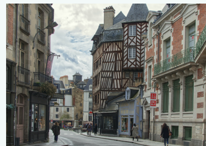
RENNES Culture | Office de Tourisme tourisme-rennes.com