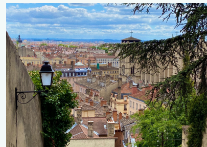
LYON Culture | Ville de Lyon