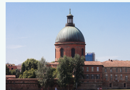
TOULOUSE La vie culturelle à Toulouse : expositions, théâtre, concerts... toulousesecret.com