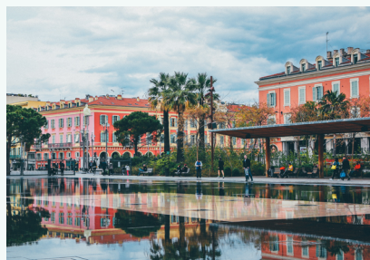
NICE Culture | Ville de Nice