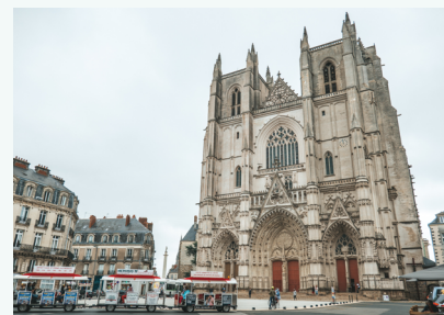
NANTES Culture | metropole.nantes.fr