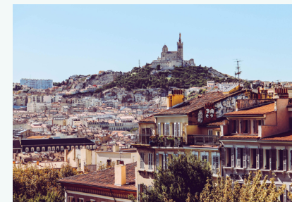
MARSEILLE Culture | Ville de Marseille