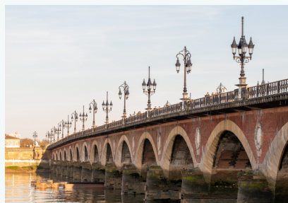
BORDEAUX Culture | Bordeaux & https://www.bordeaux-tourisme.com/